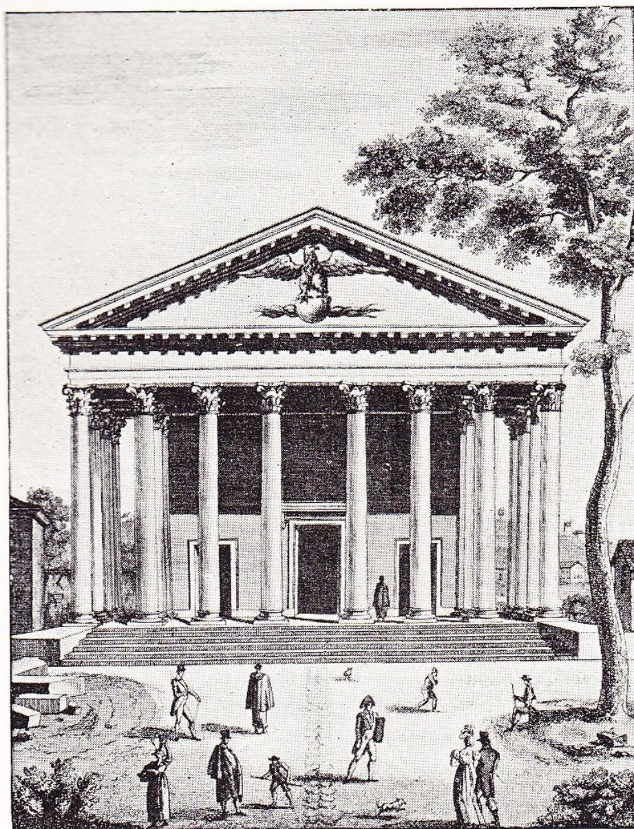
FAÇADE DE LA MADELEINE.

D'après une gravure du temps. — (Musée Carnavalet.)